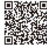
人材開発支援助成金